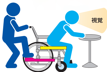
① 前かがみになり、足を少しひく。