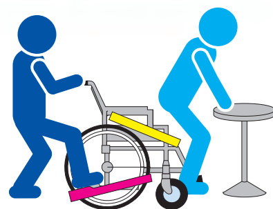
③ 身体の重心が前方に移動し、 立ち上りを支援する。